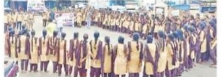
భీమిలి పాతబస్ స్టాండ్ కూడలిలో విద్యార్థుల మానవహారం