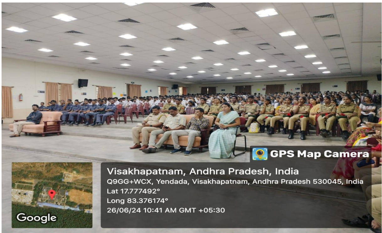
Staff and students attending the session