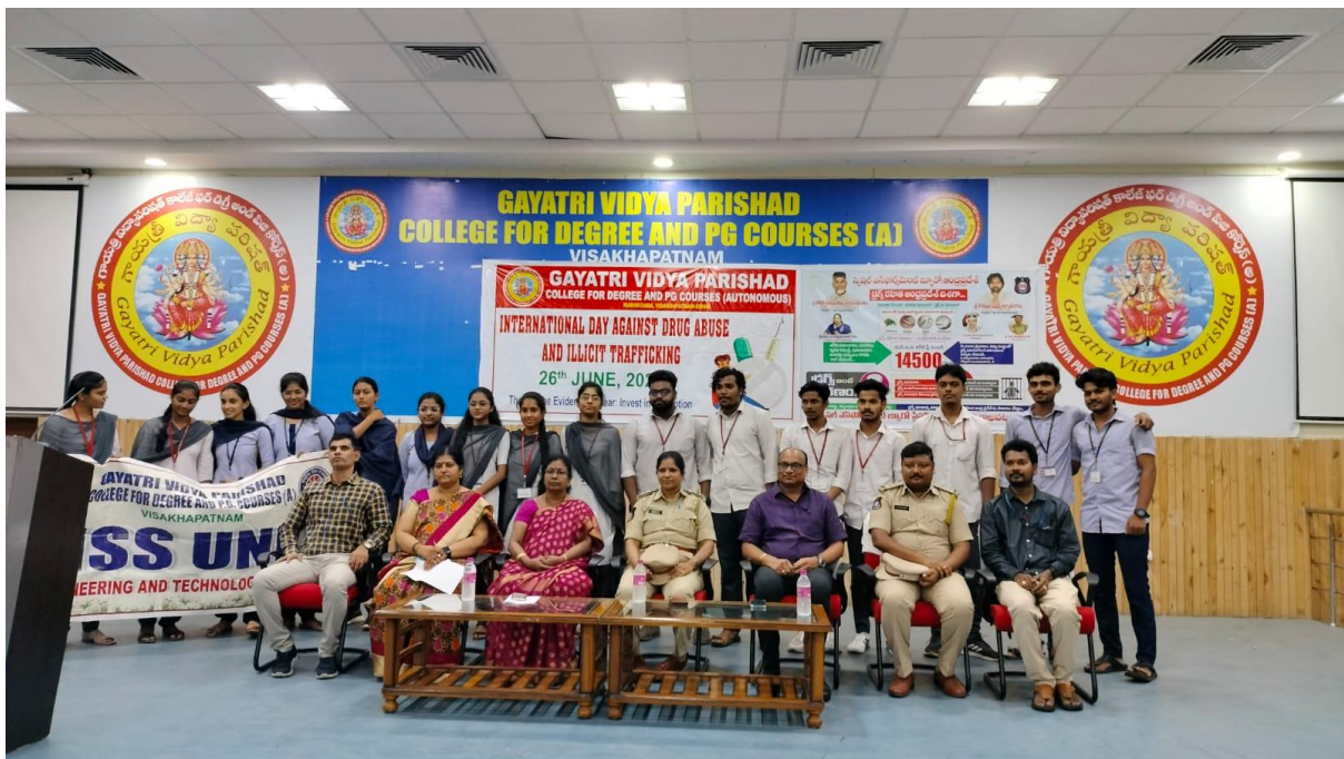
Group photo of all the NSS Volunteers participated in the session