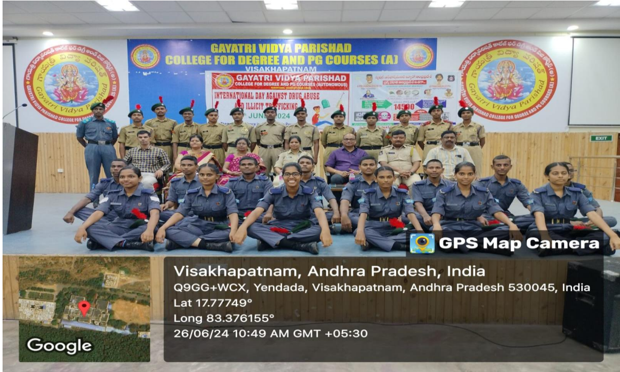
Group Photo of NCC Cadets Participated in the session