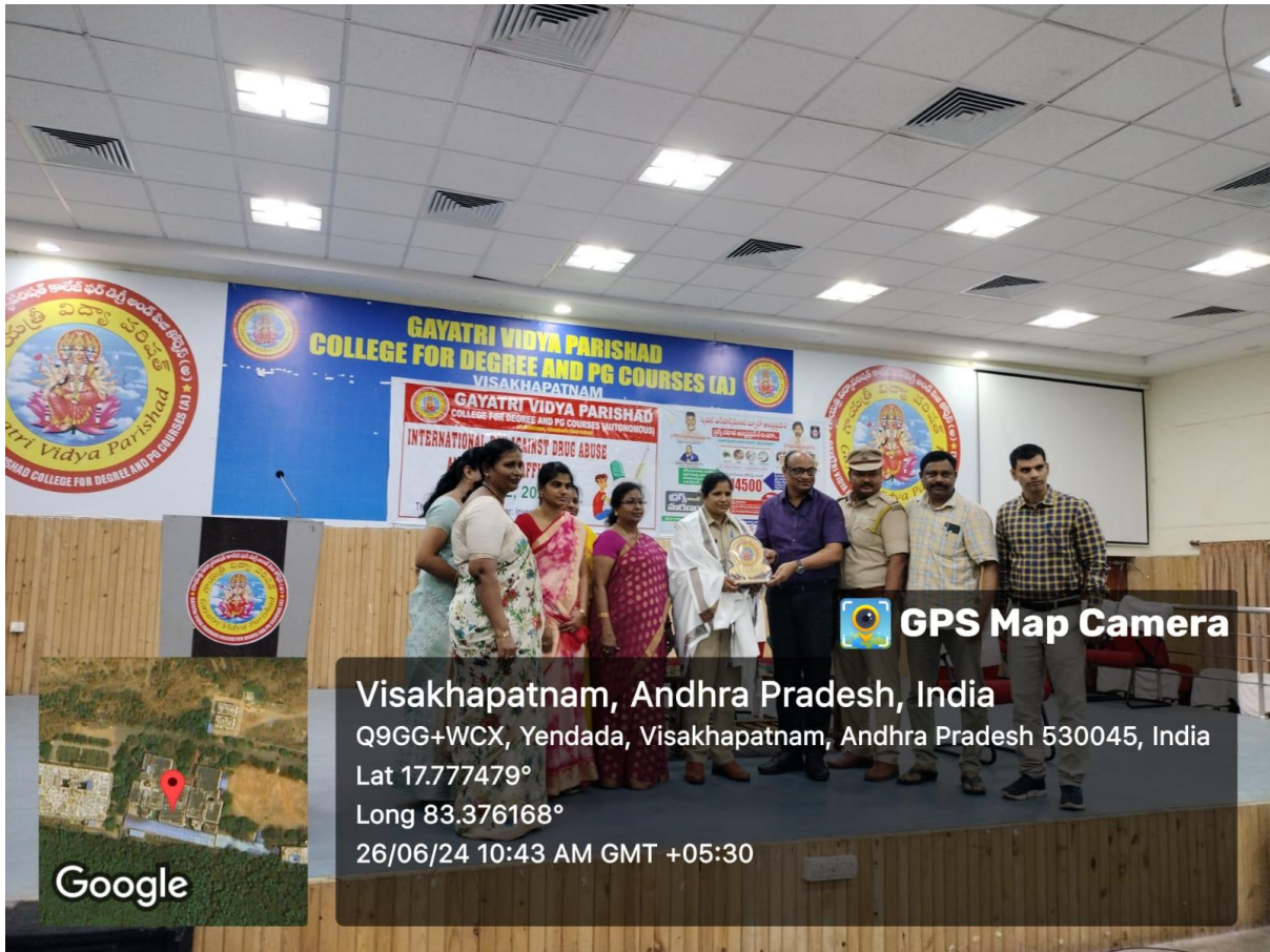
Felicitation of the chief guest by principal and staff of the college